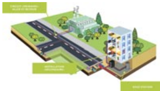
Schéma de présentation du fonctionnement d'un réseau de chaleur biomasse.

Un projet ambitieux va voir le jour avec la création d'un réseau de chaleur biomasse entre le Centre culturel Anatole Lambert et l'EHPAD L'Oustaou de Zaou. Objectif : remplacer les chaudières actuelles (fioul et gaz) par une solution plus écologique et économique. Ce projet structurant est inscrit dans le programme Petites Villes de Demain, et représente un investissement de 47 124 € TTC pour l'assistance à maîtrise d'ouvrage.